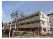
『オフィス津田沼VI』 総武・中央線有楽町線 津田沼駅 徒歩11分 間取り:1R 24.3㎡