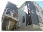
『Katic紗蓮寺』 東急東横線 紗蓮寺駅 徒歩4分 間取り:1R 14㎡