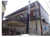
『葉林コーポ』 東武鉄道野田線 北大宮駅 徒歩4分 間取り:2DK 34.71㎡