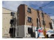
『川崎レジデンス』 鶴見線 武蔵白石駅 徒歩10分 間取り:1K 20㎡