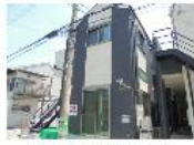
『セレノ田浦I・II』 横須賀線 田浦駅 徒歩7分 間取り:1K 18~19㎡