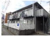
『サンライズグリーン』 西武鉄道多摩湖線 武蔵大和駅 徒歩18分 間取り:2DK 35㎡