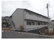
『フラットテン』 東武鉄道野田線 逆井駅 徒歩7分 間取り:1K 23.75㎡