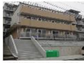
『グランドール二俣川』 相模鉄道本線 二俣川駅 徒歩10分 間取り:1K 20.06㎡