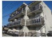
『コンフォート桜木』 京浜東北・根岸線 大宮駅 徒歩12分 間取り:1K 21.11㎡