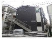
『Primo井土ヶ谷』 横浜市ブルーライン 時田駅 徒歩4分 間取り:1R 13㎡