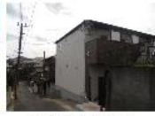
『ビッグフラワー』 総武・中央線有楽町線 新検見川駅 徒歩4分 間取り:1K 22.35㎡