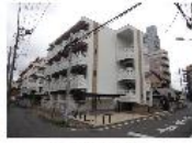
『リモネージュ』 京浜東北・根岸線 大宮駅 徒歩10分 間取り:1K 21.11㎡