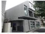
『LA CHACONNE』 東急大井町線 等々力駅 徒歩4分 間取り:1LDK 40.69㎡