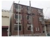
『クリエイト上井草』 西武鉄道新宿線 上井草駅 徒歩17分 間取り:1K 20~32㎡