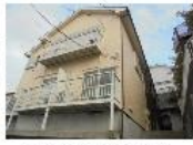
『サンヴェール菊名』 東急東横線 菊名駅 徒歩6分 間取り:1K 19.60㎡